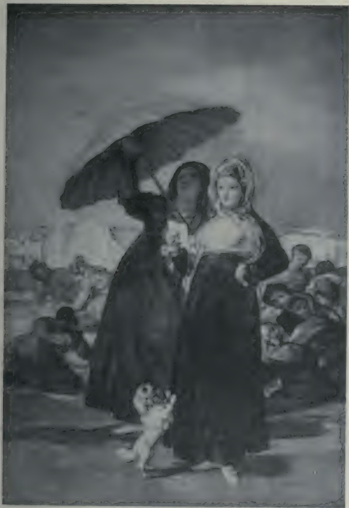
Quando elles sont jeunes! Tableau de Francisco Goya, (Musée de Lille.)